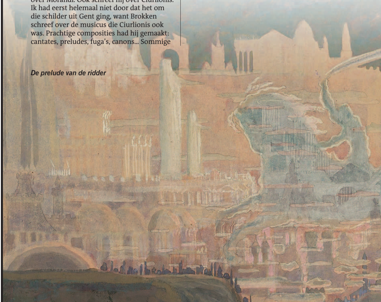
De prelude van de ridder