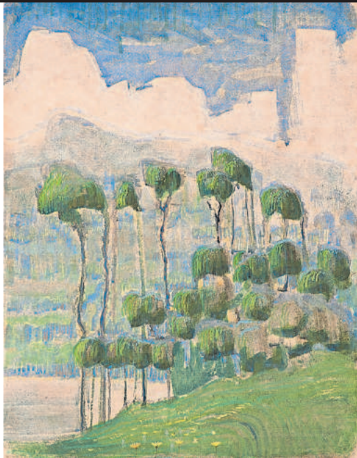
Mikalojus Konstantinas Ciurlionis - Zomer

„Ik las een stuk van schrijver Jan Brokken over Morandi. Ook schreef hij over Ciurlionis. Ik had eerst helemaal niet door dat het om die schilder uit Gent ging, want Brokken schreef over de musicus die Ciurlionis ook was. Prachtige composities had hij gemaakt: cantates, preludes, fuga's, canons... Sommige