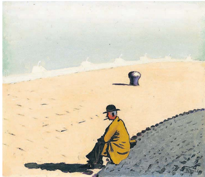
Dirk Nijland, 'Zittend heertje' 1925, Collectie Museum Belvédère

Al ver voor Museum Belvédère zijn deuren opende, had Mercur natuurlijk al een omvangrijke collectie