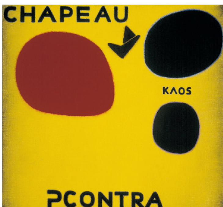
'Chapeau contra chaos: kaos' 1996-1998, olieverf op doek, 60 x 65 cm.