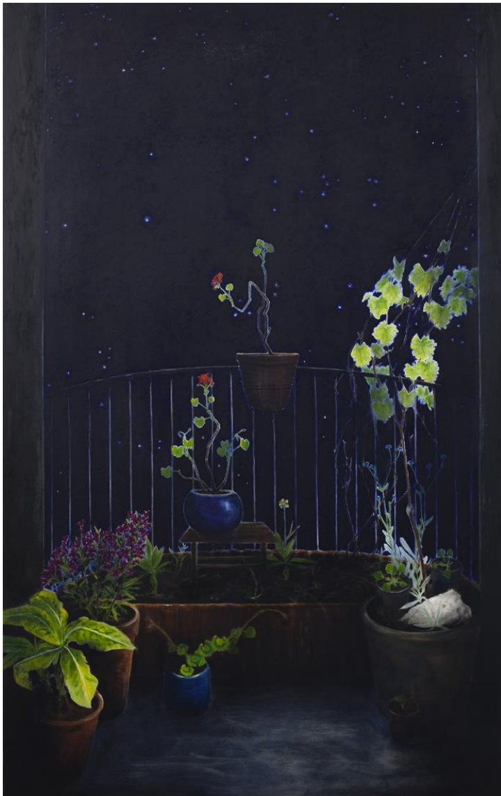
Bodo's balkon , 2020, 118x188 cm, olieverf op doek

In drie donkere schilderijen uit 2020, 'Banaan', 'Bodo's balkon' en 'Catonica' zien we verschillende planten, waaronder een bananenplant, een geranium en een pannenkoekplantje, afgebeeld tegen donkerblauwe sterrennachten. De sterren zinderen in de lucht en lijken te knipogen naar de beschouwer. Maar het is niet het schilderij dat beweegt: wij zijn het. Van Leeuwen heeft een manier van overschilderen gebruikt waarbij hij het witte centrum van de sterren heeft uitgespaard in de verf, om vervolgens de diepe kleuren van de lucht eromheen te schilderen. De nacht is opgebouwd uit blauw- en zwart-tinten en raakt bijna aan de planten op de voorgrond. Maar net niet helemaal, want als we van dichtbij gaan kijken, zien we hoe de planten een stralenkrans krijgen waar de nacht ze niet aanraakt. Niet onvergelijkbaar met de echte sterrenhemel creëert deze manier van werken een diepteverschil dat niet direct waarneembaar is, maar wel een zuigend effect heeft, waarbij je blik naar de lichtende puntjes wordt gebracht.