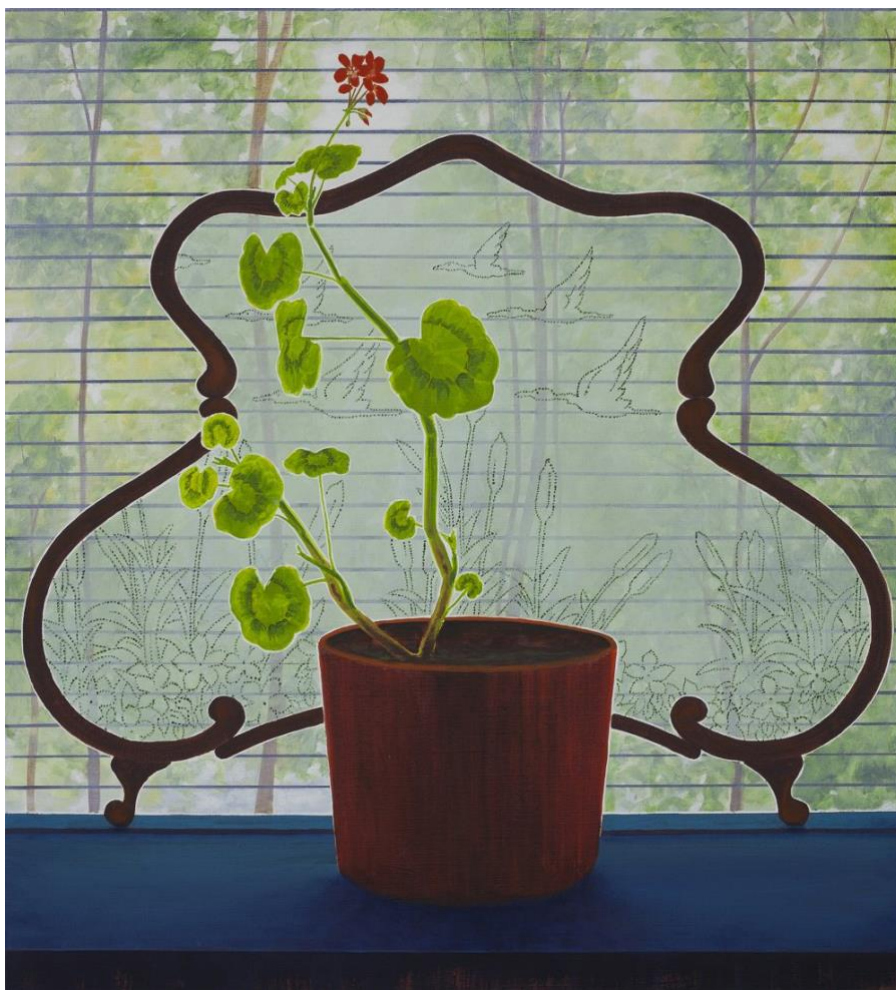
the island anthony , 2020, 60x66 cm, olie en acrylverf op doek

Of de geranium inmiddels nog steeds gezapig is, daar kunnen we over twisten. Zeker na het afgelopen jaar waarin we zo dichtbij huis moesten blijven vanwege de corona-crisis is de interesse in alle typen planten enorm toegenomen, van eigen moestuinen tot het aanleggen van binnenhuis-mosmuren. Feit is wel dat Van Leeuwen duidelijk expres omgevingen componeert die op het eerste gezicht een beetje ouderwets aandoen, zoals het plantenscherm met vliegende eenden in the island anthony .