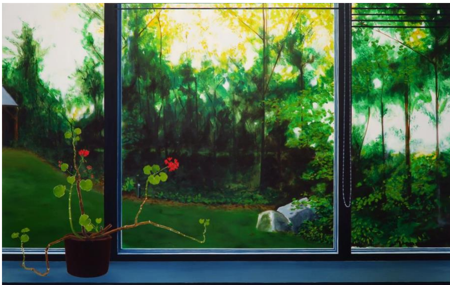
Suilen , 2020, 188x188 cm, acryl en olieverf op doek

De tentoonstelling heet Suilen , een verbastering van het Sesamstraat-liedje 'Schuilen' dat favoriet was bij het zoontje van de kunstenaar toen het jongetje zijn beentjes brak tijdens een vakantie in 2020. Het titelstuk van de tentoonstelling is het uitzicht vanuit dat vakantiehuisje: een grasveld, een bosje, een stukje schuur, allemaal gevat in een meedogenloos recht geschilderd kozijn. Het enige dat zich onttrekt aan zowel de rechtlijnigheid van het huis als het wollige vormgeving van de natuur buiten, is de geranium (pelargonium zonale) op de vensterbank wiens takken schijnbaar willekeurig alle kanten op groeien. De takken van de geranium staan iets af tegen de achtergrond, een effect dat verkregen is door de vormen uit te sparen in de direct omringende verf.