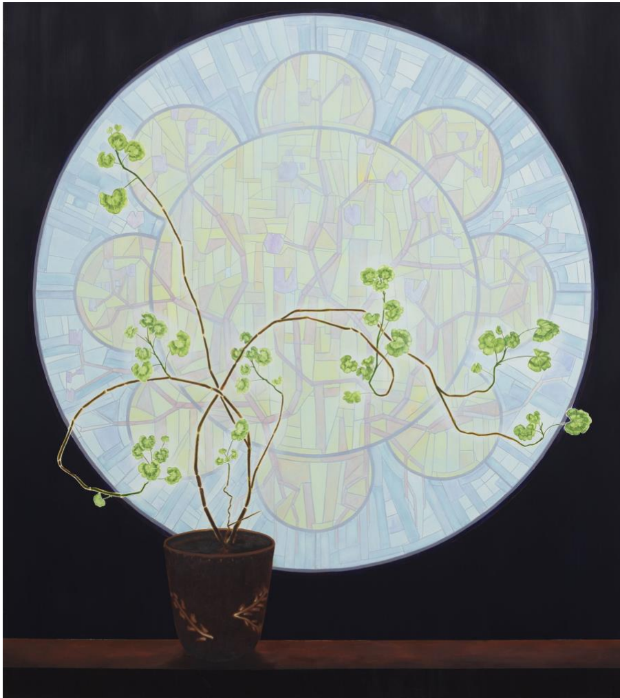
Rosace , 2020, 125 x 140 cm, olieverf op doek