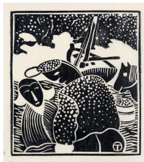
Het vaarwel tot ziens

Maar lang duurt die periode niet. Tames Oud wil experimenteren. In de oorlogsjaren