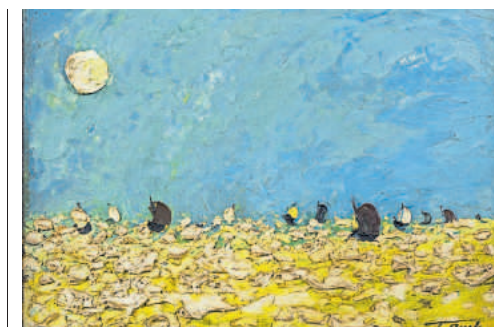
Het gele zeetje