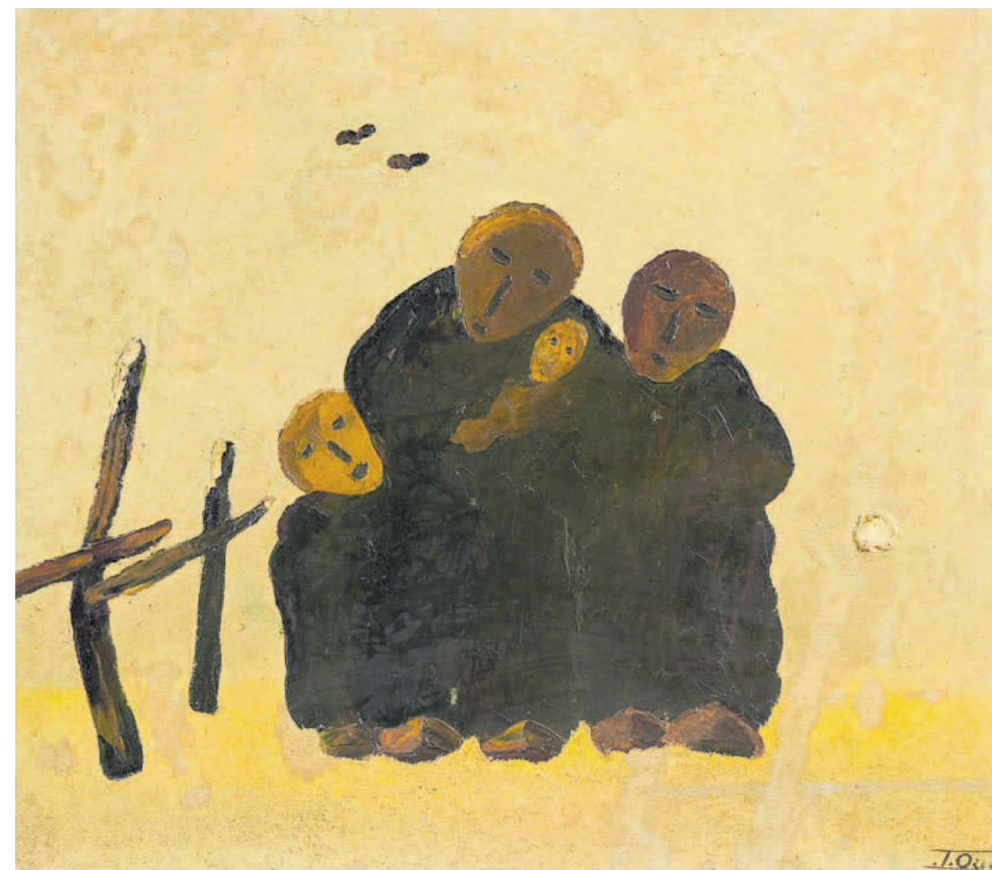
Tames Oud - Terug van de arbeid

Eiland van verlangen is een tentoonstelling in tweevoud, te zien in het Cultuur-Historisch Museum Sorgdrager te Hollum, Ameland (17 juni t/m 23 oktober) en in Museum Belvédère in Oranjewoud (17 juni t/m 24 september). Openingstijden Museum Sorgdrager ma-vr 11-17 u en za-zo 13-17 u. Openingstijden Museum Belvédère di-zo 10-17 u. Bij de tentoonstelling verscheen het boek Tames Oud - Eiland van verlangen , met teksten van Gitte Brugman en Han Steenbruggen.