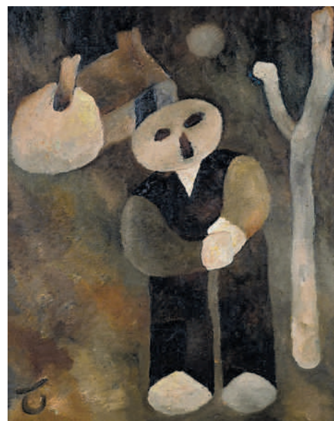
Tames Oud - Taak volbracht