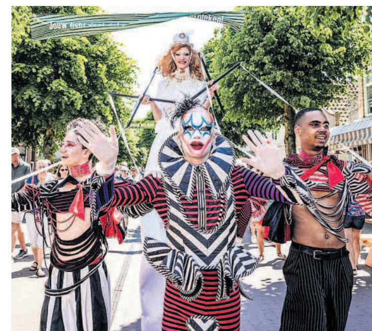
ChelseaBoy's Circus: drag op straat.