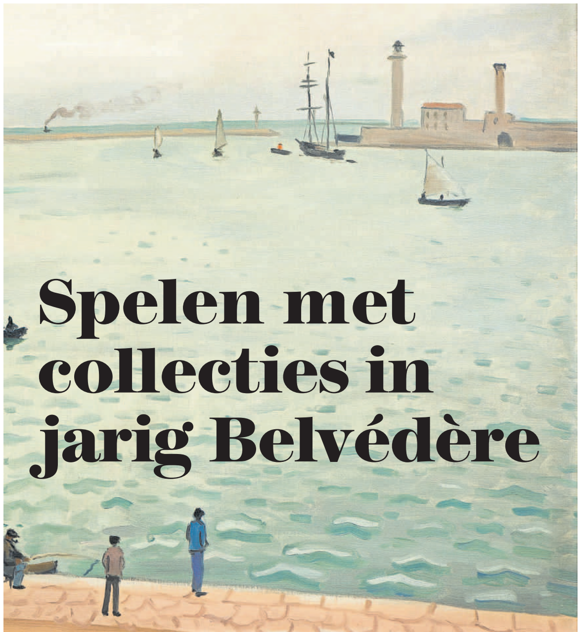
Albert Marquet - Scène de port (Sète) (1924).

„Ter gelegenheid van het 20-jarig bestaan wilde ik een tentoonstelling maken met onze werken en werken uit andere museale collecties. Ik wilde laten zien hoe je op een nieuwe manier om kunt gaan met ons gezamenlijk openbaar kunstbezit, de Collectie Nederland. Ik wilde mikken op nationale topstukken, die naar inhoud en mentaliteit zich hier thuis zouden voelen.” Maar dit plan bleek vooralsnog te ambitieus. „Daarom heb ik ervoor gekozen een expositie te maken met topstukken van verzamelaars met wie we een goede relatie hebben.”