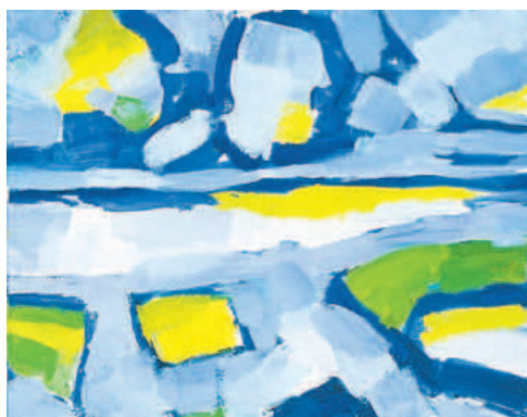
Gerrit Benner - Wolken in Friesland