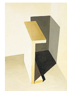
White Box Painting 169