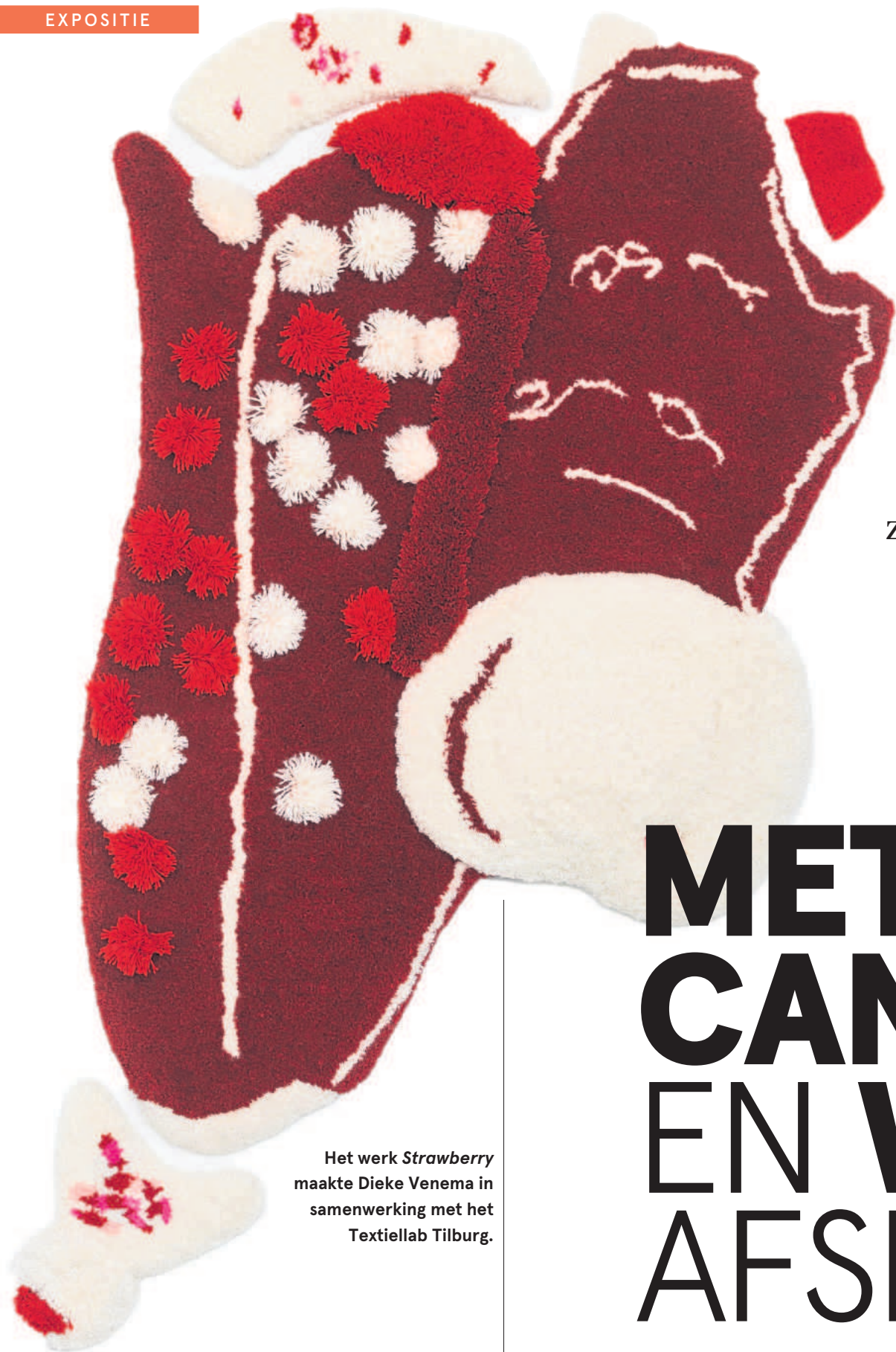
Het werk Strawberry maakte Dieke Venema in samenwerking met het Textiellab Tilburg.

Hoe kunnen individuele werken zich tot elkaar verhouden, zonder aan eigenheid en kracht in te boeten? Deze vraag stelt Dieke Venema zich bij het maken van zowel beelden als wandobjecten van metaal, canvas en wol.