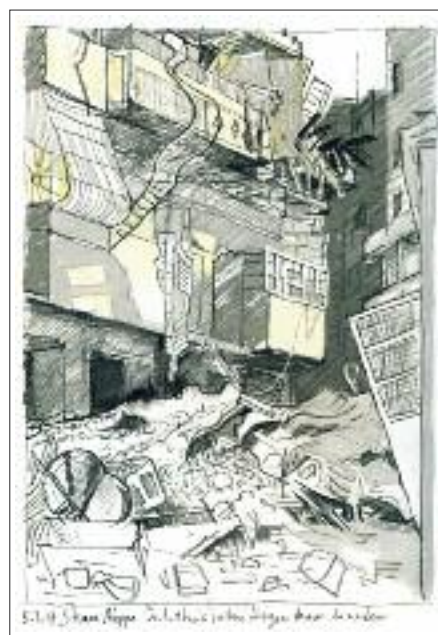
Barricade in Shaar.