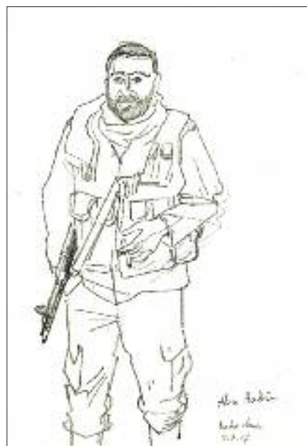
Soldaat in Baba Amr.